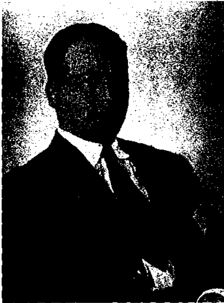
Sadri Etem Bey